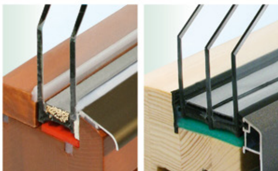
řez oknem: dvojsklo a trojsklo